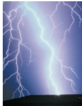
El riesgo de daños provocados por descargas eléctricas en las palas de los aerogeneradores aumenta notablemente a medida que la longitud de las palas va creciendo.