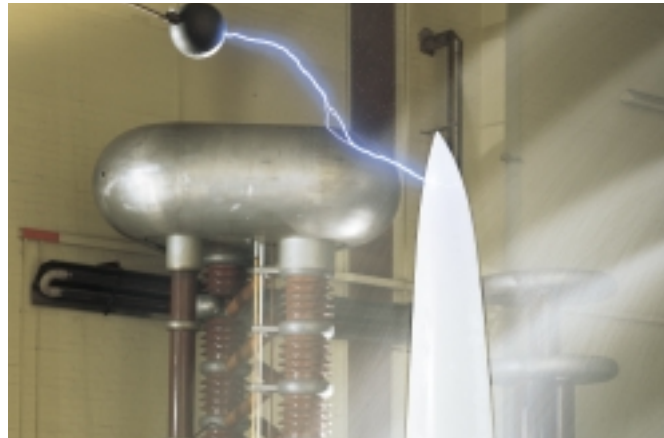
La descarga eléctrica de un rayo puede dañar la estructura de la pala, si el sistema de protección no capta y deriva la energía producida.