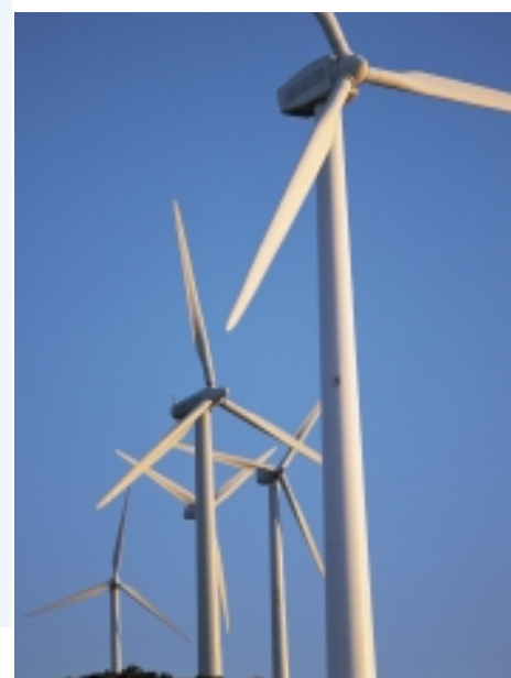
En la actualidad están instaladas en el parque 24 turbinas, de las que 20 están equipadas con palas LM.

El parque de Sotavento nació como una iniciativa del Gobierno Regional de Galicia (Xunta de Galicia) dentro del Plan Eólico Estratégico iniciado en 1995. En seis años, Galicia ha pasado de una potencia eólica testimonial a más de 1000 MW instalados, siendo la región más importante de España y referencia para otros Gobiernos Regionales, que han desarrollado posteriormente programas similares.