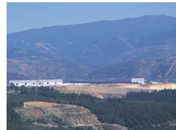
La fábrica de LM de Ponferrada es una de las tres plantas de producción que hay en España, sumando las tres una superficie total de más de 35.000 m 2 .

Una parte relevante de este desarrollo industrial es LM que ha realizado un importante esfuerzo inversor para asegurar a nuestros clientes en España y en el área mediterránea, una seguridad de suministro local y una atención próxima y eficaz, con unos resultados muy satisfactorios para todos los agentes del negocio eólico español, con tres fac-