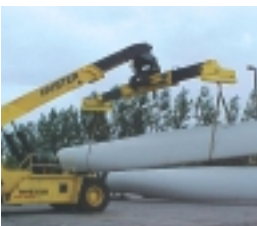
Durch den Einsatz moderner Produktionstechnologie wird die Qualität der fertigen Rotorblätter gewährleistet.