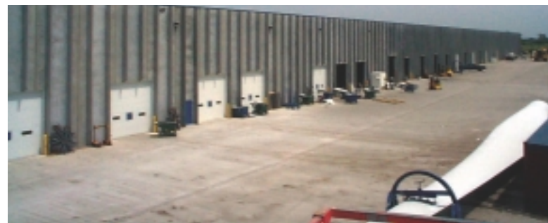
Dieser neue Ausbau erweitert die vorhandene LM-Gebäude in den USA um 3500 m 2 .

Das amerikanische Werk von LM Glasfiber hat seine Produktionsanlagen um 3500 m 2 erweitert. Durch diesen letzten Ausbau umfasst die amerikanische Rotorblattfertigung nun insgesamt 11.200 m 2 . Geschäftsführer Craig Hoiseth von LM erklärt: