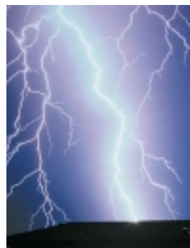
Das Risiko für Blitzschäden an Rotorblättern ist wesentlich dadurch gestiegen, dass die Blätter immer länger geworden sind.

„Wir nehmen den Blitzschutz sehr ernst. Und unser Ziel ist es natürlich, noch bessere Lösungen zu entwickeln, als wir jetzt schon anbieten können.“