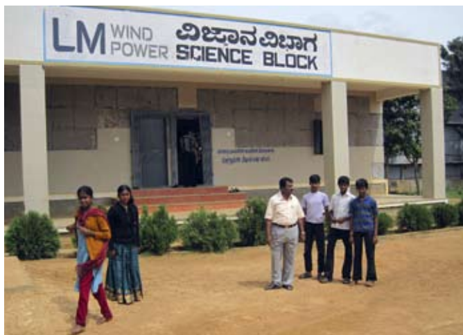
LM Wind Power ha contribuido a crear un ala dedicada a las ciencias en el instituto gubernamental Doddahullur, en Hosakote, India.