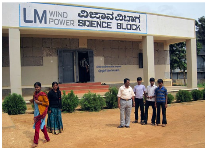
LM Wind Power bidrog til at skabe de nye fysiklokaler på Doddahullur Government High School i Hosakote, Indien.

DODDAHULLUR HIGH SCHOOL - I EN KLASSE FOR SIG